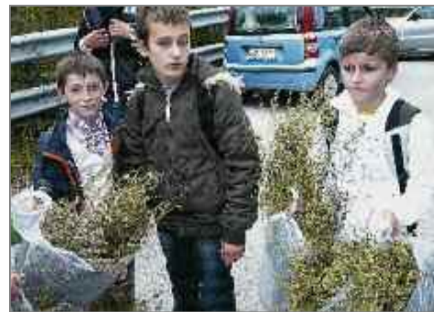
Μαθητές του Γυμνασίου οι οποίοι μας πρόσφεραν τσάι του βουνού που είχαν μαζέψει για μας.