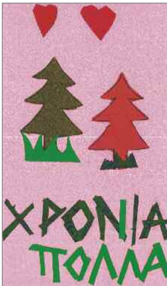
Οι ευχές των παιδιών