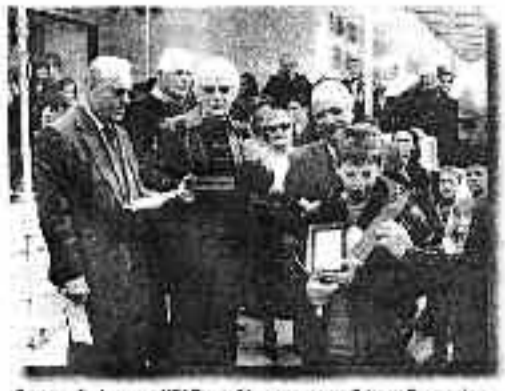
Οι συνταξιούχοι του ΗΣΑΠ «υιοθέτησαν» τα παιδιά του Γυμνασίου Σμίνθης. Από την εκδήλωση βραβεύσεων