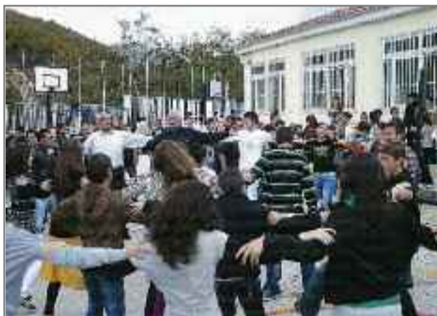
Αγκαλιασμένοι οι μαθητές, οι μαθήτριες, οι καθηγητές και οι συνταξιούχοι των ΗΣΑΠ, χορεύουν