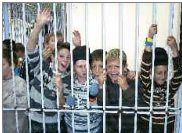
Μαθητές του Δημοτικού Σχολείου