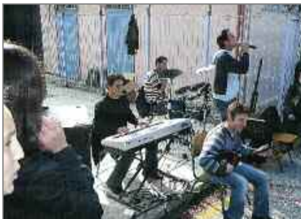
Η ορχήστρα που μας χάρισε ευχάριστες στιγμές και χαράς με τα ωραία της τραγούδια