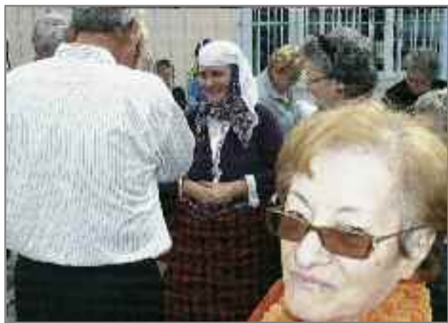
Παμάκα με την παραδοσιακή ενδυμασία